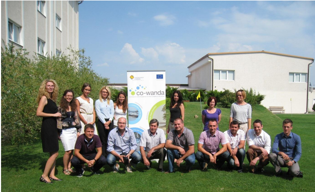
Avugst 2013: Studijska poseta i tehnički sastanak u Kladovu, Srbija

prikupljanje ove vrste otpada besplatno, mali broj plovila u unutrašnjem vodnom transportu je do sada koristio ovu mogućnost. Razlozi leže u administrativnim preprekama koje se susreću na Dunavu odnosno dugotrajnih procedura koje povećavaju troškove. Kada otpočne izrada predloga Međunarodne konvencije o unpravljanju brodskom otpadu na Dunavu , analiziraće se sve prepreke vezane u postojećim pravnim okvirima, kako bi se svim brodovima koji plove pod zastavama podunavskih zemalja ponudila rešenja za nesmetanu isporuku brodskog otpada u svim podunavskim zemljama.