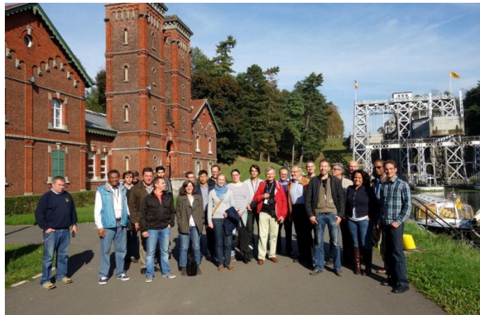
„Smart Rivers” Konferencija 2013

Godinu dana nakon početka projekta, konzorcijum može biti ponosan ne samo na obavljeni posao već i na reputaciju koju je stekao na međunarodnom nivou. Projekat je predstavljen na nekoliko međunarodnih konferencija i događaja, uključujući i konferenciju „PIANC SMART RIVERS CONFERENCE 2013” održanu u Mاستrihtu (Holandija) i Liježu (Belgija) u periodu 23-27. septembar 2013. godine. Projekat CO-WANDA i njegovi ciljevi predstavljeni su međunarodnim stručnjacima u oblasti unutrašnje plovidbe iz Evrope, Japana, Kine i SAD.