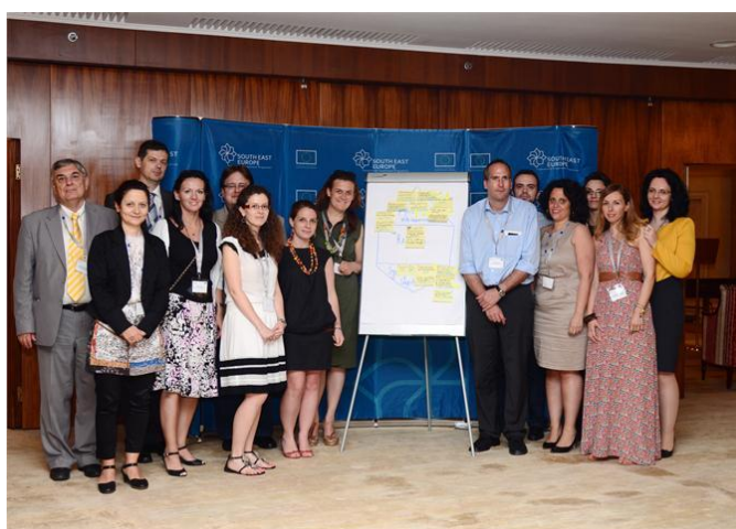
CO-WANDA eksperti na prvoj “Pole 9” radionici u Bukureštu

www.southeasteurope.net/en/achievements/capitalisation_strategy/ .