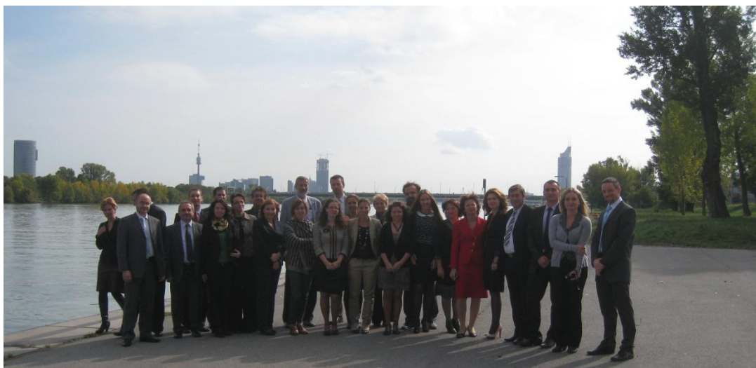
Konzorcijum projekta CO-WANDA na početnom sastanku u Beču, oktobar 2012. godine

Dve godine pionirskog rada u domenu upravljanja brodskim otpadom su pred nama. Sastanak Odbora za implementaciju je planiran za proleće 2013. godine, kao prvi korak ka pripremi predloga IDSWC. Naredni koraci biće vezani za implementaciju pilot testova koji će biti sprovedeni u leto 2013. godine.