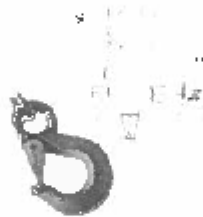
Kuka sa okom U-31