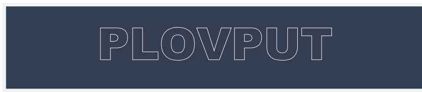
Слика 1. Изглед натписа